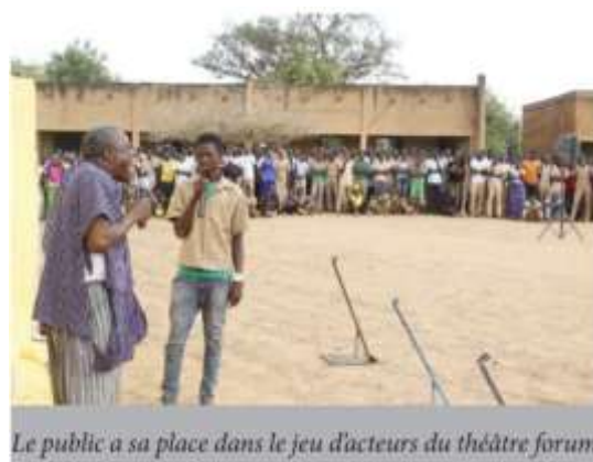
Le public a sa place dans le jeu d'acteurs du théâtre forum

Au sujet de l'âne, dans les différentes séquences de la prestation, la troupe du Théâtre de l'espoir de M'Ba boanga a abordé les questions de son rôle important dans la vie des ménages , son alimentation , sa santé , son habitat .