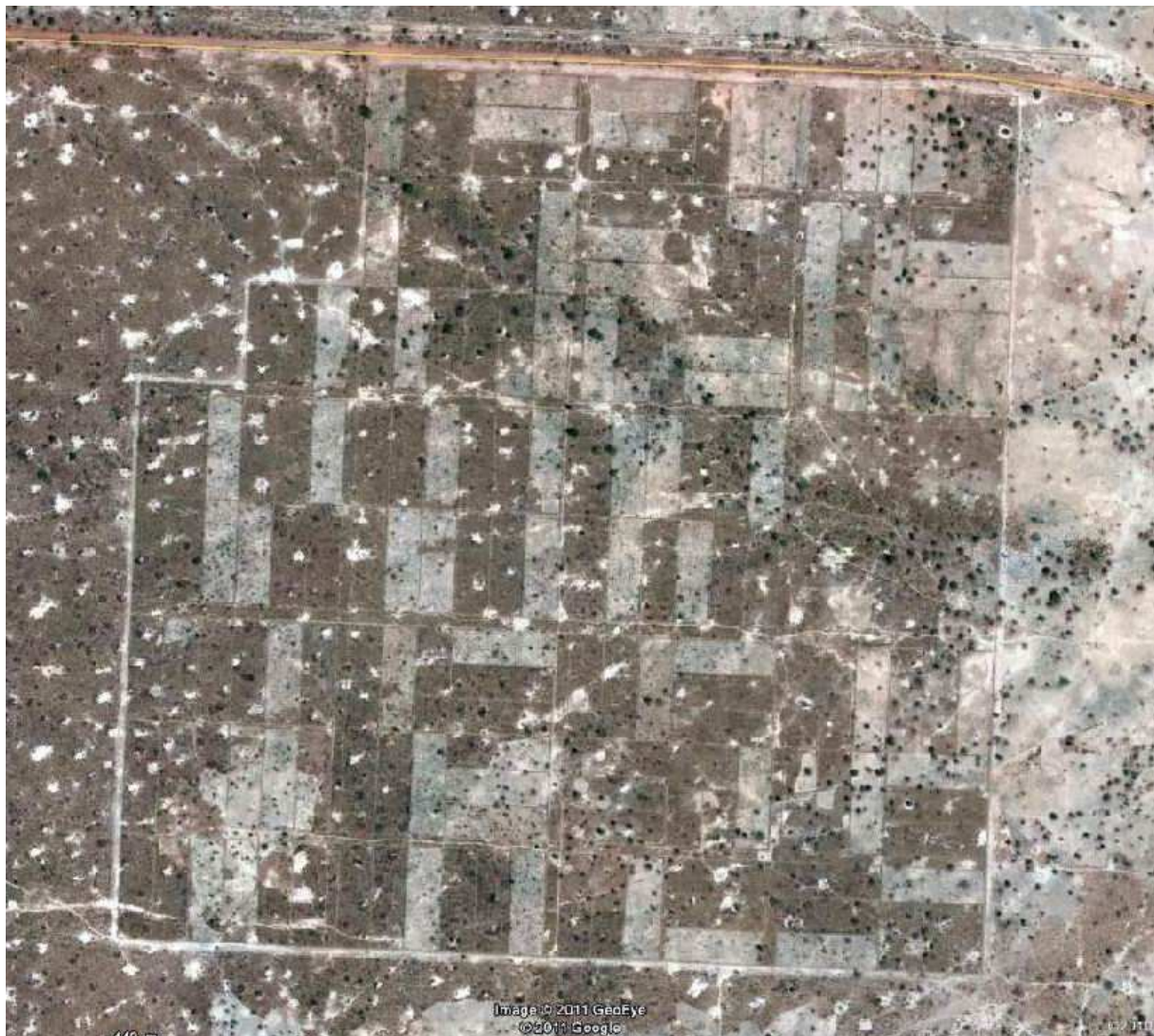
Vue satellitaire du périmètre bocager de Cissé-Yargho

01 BP 551 / Ouagadougou 01 / BURKINA FASO Courriel : terreverte.burkinafaso@laposte.net www.eauterreverdure.org